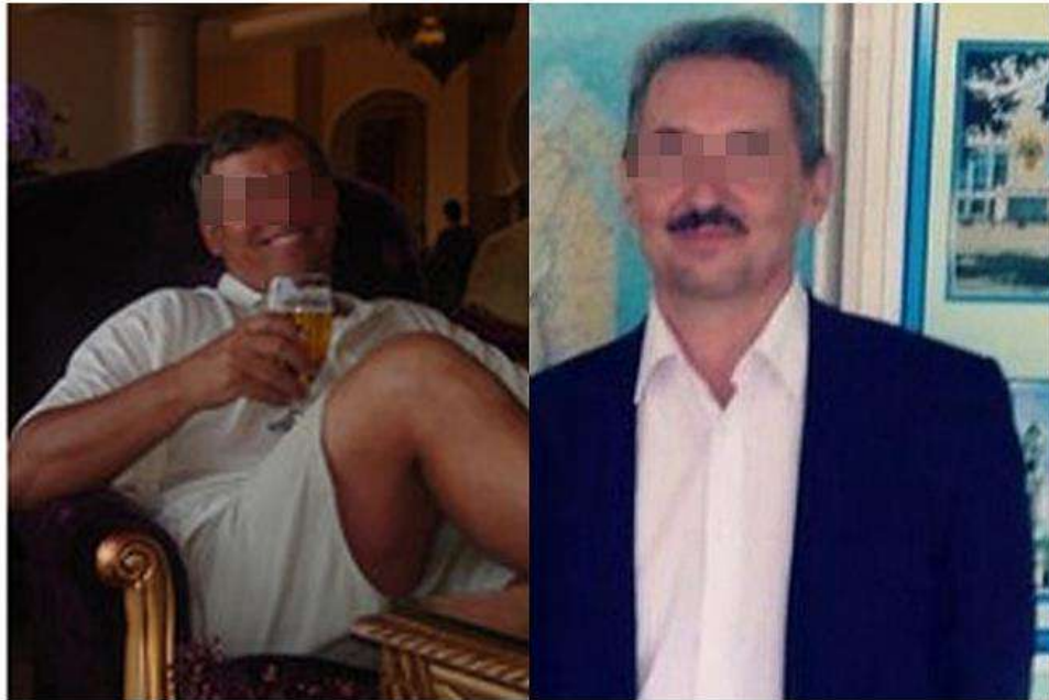
Виталий Курсков и Игорь Поплевко.

В Астрахани в закрытом режиме идет суд над экс-министром ТЭК и охраны окружающей среды Астраханской области Виталием Курсковым и бывшим депутатом областной думы Игорем Поплевко . Они обвиняются в преступлениях на сексуальной почве в отношении несовершеннолетних.